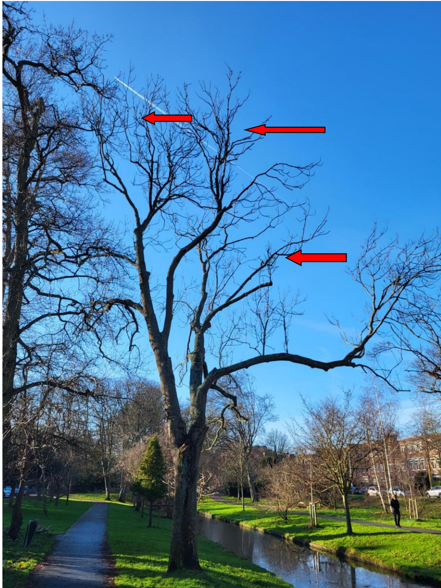
Terugstervende kroon ten gevolge van essentaksterfte.