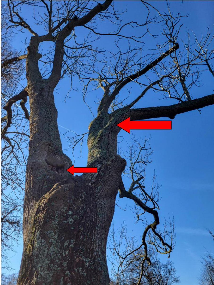
Grote inrottende wonde onderaan gesteltak (kleine pijl). Lengtescheur in gesteltak (grote pijl).