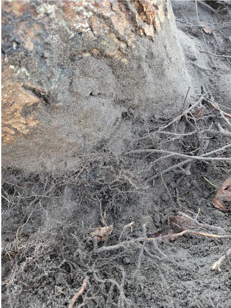
Adventief wortels vanuit de ent aan de duwzijde van de boom.