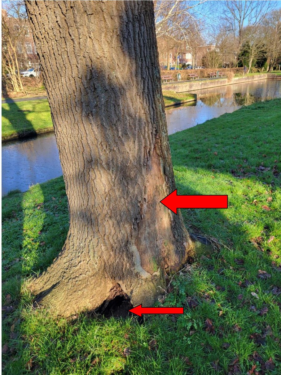
Holte in de stamvoet en grote stamwond.