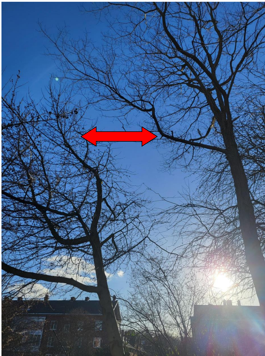
Scheefstand en duidelijke ruimte tussen de kronen.