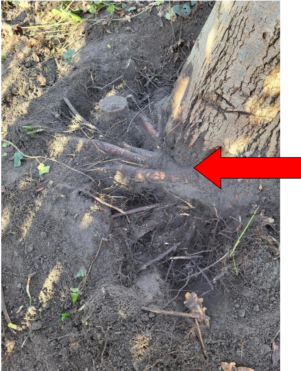
Adventief wortels vanuit de ent aan de trekzijde van de boom. Vorming van wurgwortels.