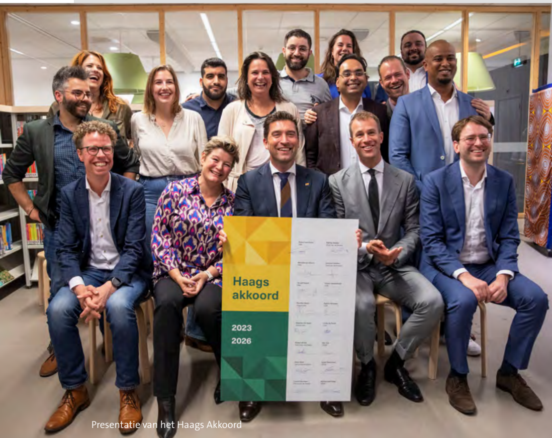
Presentatie van het Haags Akkoord