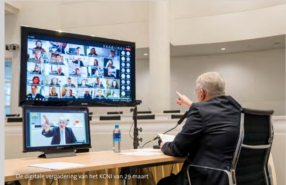
De digitale vergadering van het KCNI van 29 maart