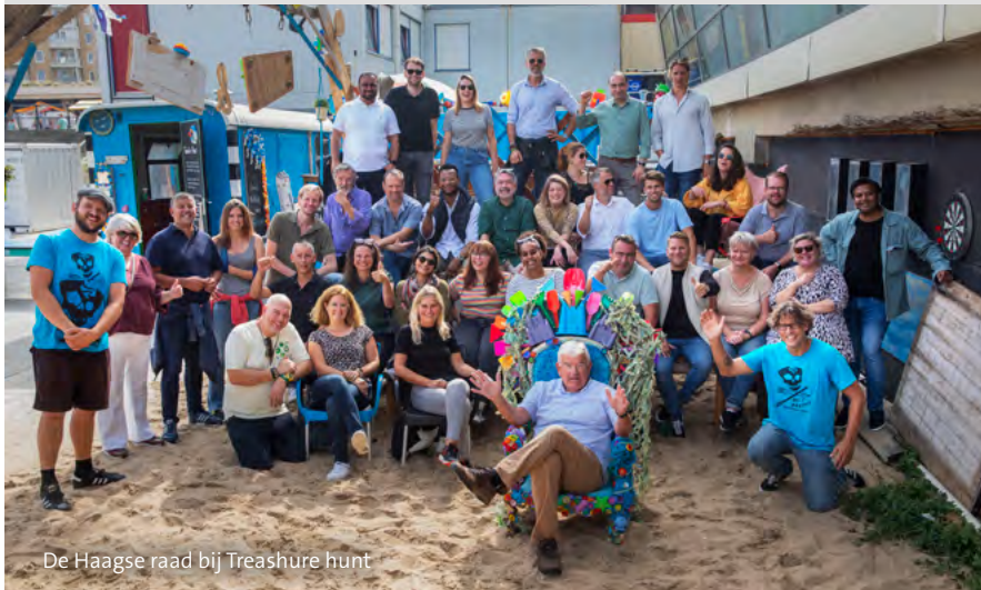
De Haagse raad bij Treashure hunt

Het was voor het eerst dat er tijdens de raadsconferentie ook een vrijwilligersactiviteit op het programma stond. Ook daar lag een aangenomen motie aan ten grondslag van de SP en Hart voor Den Haag. Deze partijen deden in november 2021 het voorstel om voortaan een gezamenlijke vrijwilligersactiviteit in te plannen om de onderlinge samenwerking te versterken. De raadsleden hebben onder begeleiding van de organisatie TrashUre Hunt een opruimactie gehouden op het strand van Scheveningen. Daarbij werd ruim 54 kilo zwerfvuil en bijna 2000 sigarettenpeuken van het strand geraapt.