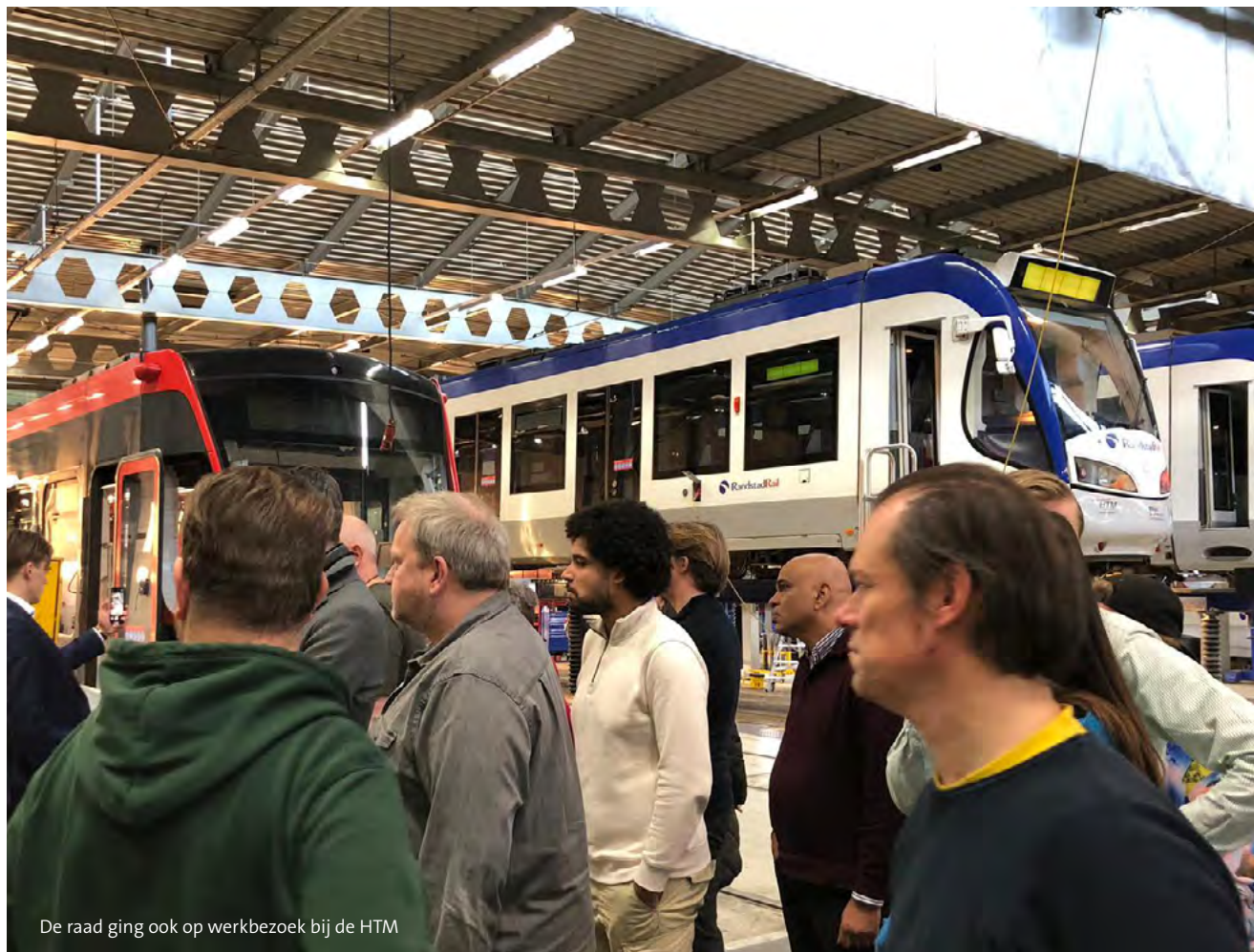
De raad ging ook op werkbezoek bij de HTM

Op werkbezoek ging de commissie bij Veilig Thuis Haaglanden, de Adviesraad voor Sport, Servicepunt XL (Wijkz), Schakenbosch, Parnassia en Plan Einstein.