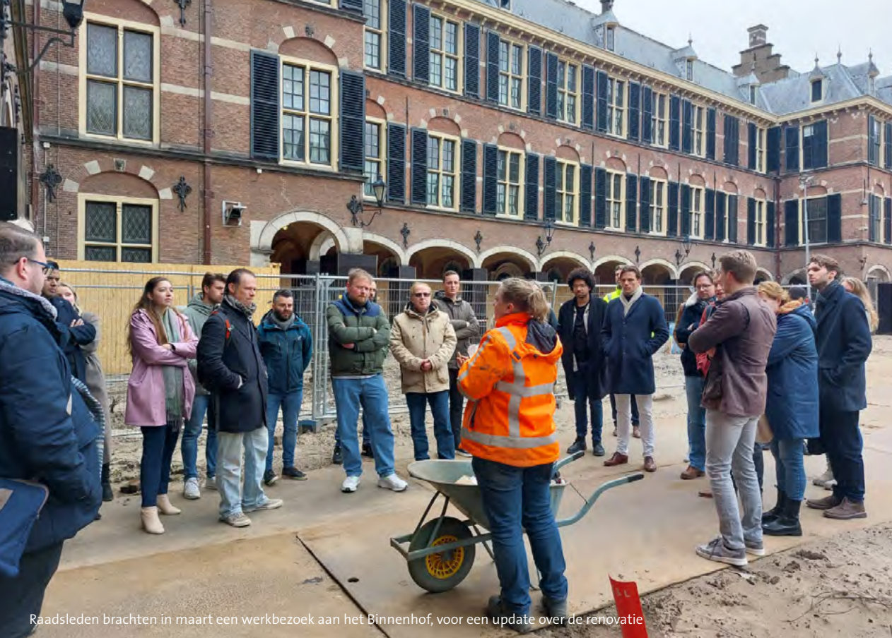
Raadsleden brachten in maart een werkbezoek aan het Binnenhof, voor een update over de renovatie